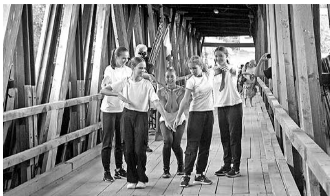
Plesna skupina NLP