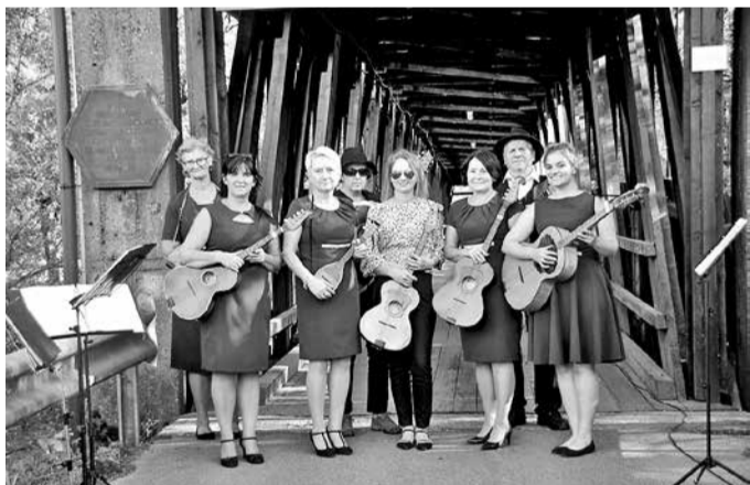
Tamburaški orkester senožeti