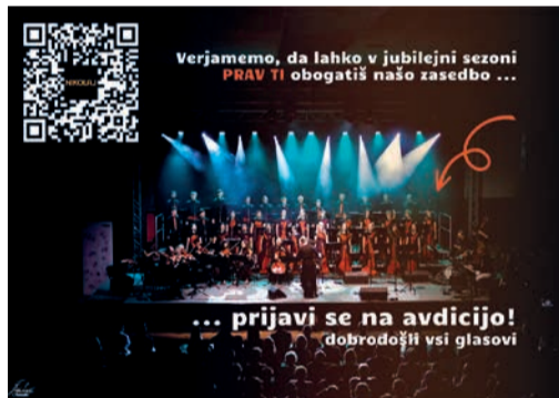
Fotografija: Žiga Lupeš; grafična obdelava: Petra Skubic