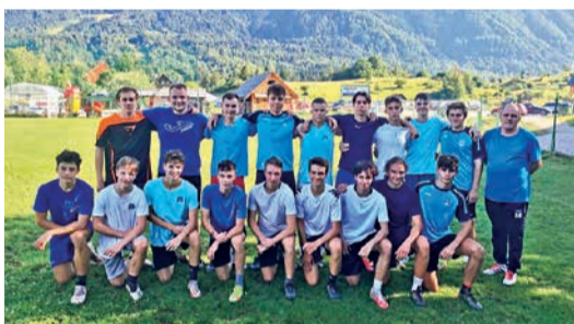
MLADINCI IN KADETI