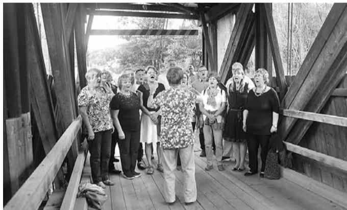
Mešani pevski zbor Miha Vahen iz Jevnice