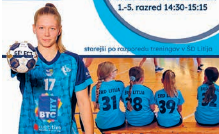
starejši po razporedu treningov v ŠD Litija

OŠ Gradec PONEDELJEK IN ČETRTEK 1.-5. razred 14:30-15:15