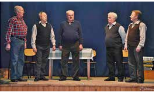
Ljudski pevci z Dol