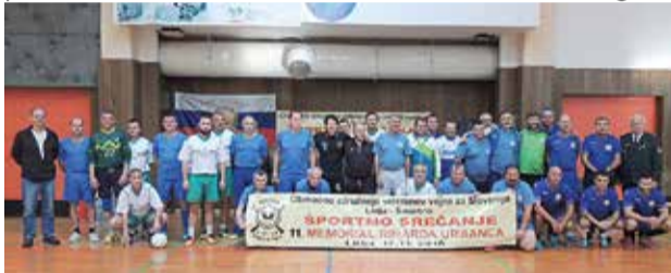
Vse ekipe malega nogometa v Športni dvorani v Litiji

Druženje veteranov pa je popestrilo tudi tekmovanje v malem nogometu ter ekipno in posamično tekmovanje v kegljanju in streljanju z zračno puško.