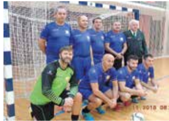
Ekipa OZ VVS Litija-Šmartno v malem nogometu

V kegljanju so sodelovale 4 ekipe. Prvo mesto je dosegla ekipa OZ VVS Litija