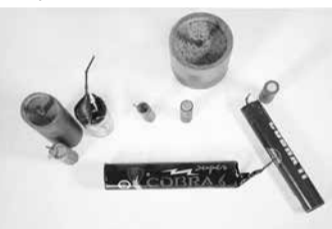
Nekaj prepovedanih pirotehničnih izdelkov

Nepremišljena, nepredvidna in objestna uporaba pirotehničnih izdelkov pogosto povzroči telesne poškodbe (opekline, raztrganine rok, poškodbe oči itd.), moti živali, ter onesnažuje okolje . Policisti bodo dosledno ukrepali proti vsem, ki bodo kršili določbe o uporabi pirotehničnih izdelkov (Zakon o eksplozivih in pirotehničnih izdelkih). Za posameznike je predvidena globa od 400 do 1200 evrov .