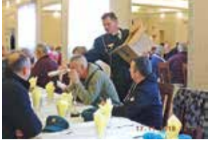
Vsi udeleženci na zaključku